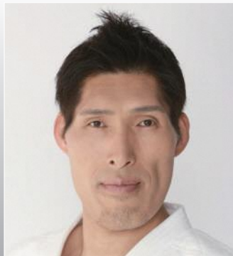
篠原 信一 柔道家