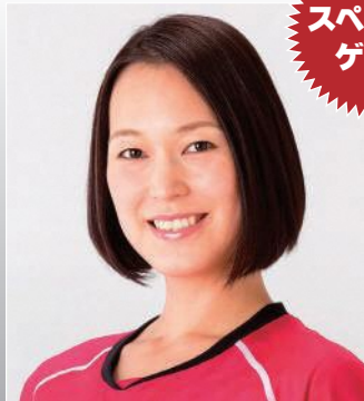
大山 加奈 元バレーボール日本代表